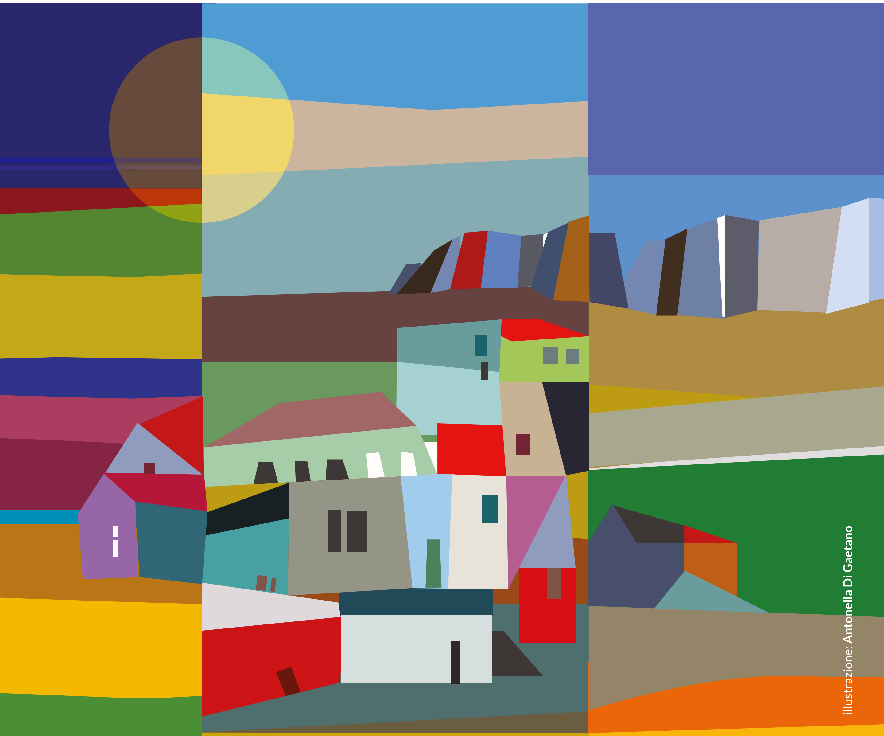
illustrazione: Antonella Di Gaetano